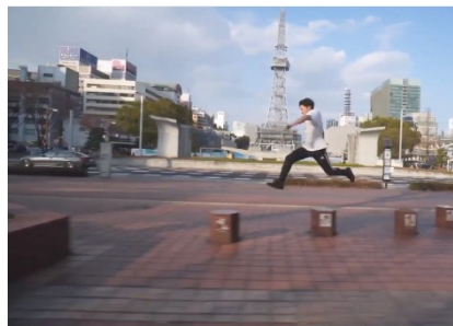
パルクール競技(イメージ)